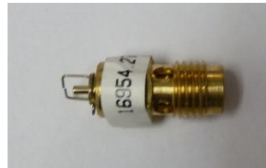
AGUJA DE PASO SUMINISTRADA POR SHERCO (270) AIGUILLE DE PAS FOURNIE PAR SHERCO (270) NEEDLE PAS PROVIDED BY SHERCO