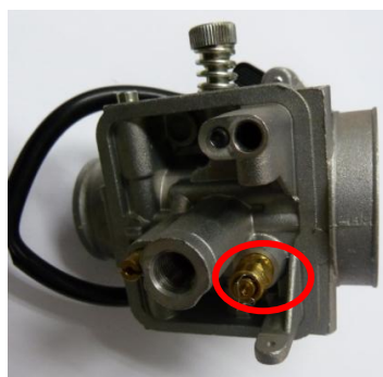
SUSTITUIDA REPLACÉE REPLACED