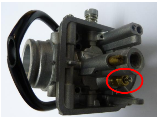
ACTUAL EXISTANTE CURRENT