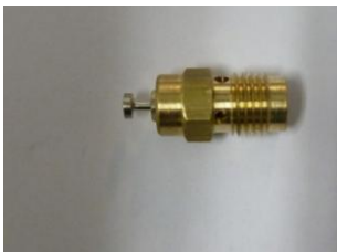
AGUJA DE PASO EXISTENTE (200) AIGUILLE EXISTANTE (200) EXISTING NEEDLE (200)

REMOVAL NEEDLE PAS EXISTING AND REPLACE FOR PROVIDED BY SHERCO.